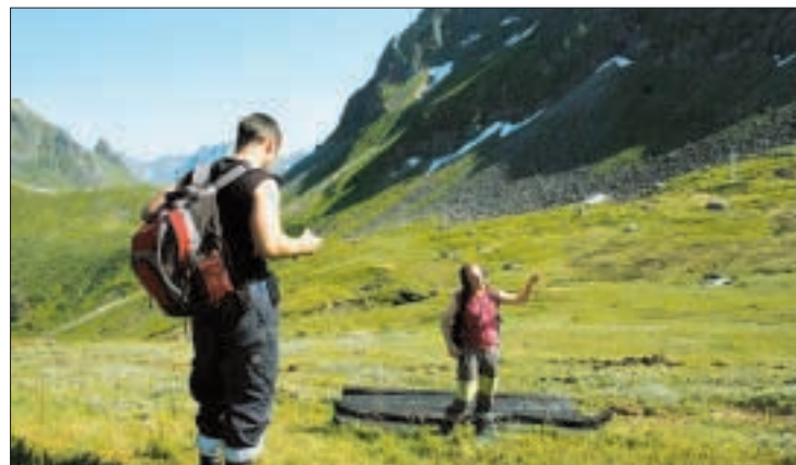
Utsikten er formidabel opp i fjellheimen.