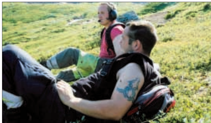
En liten pust i bakken mellom helikopterslagene.

Så bryter helikopterduren brutalt gjennom stillheten, og denne gangen tar det tid for traversen er på plass. Her er det presisjon som gjelder. Nå er det bare seks traverser igjen, mens vi følgere vakerne som er lagt ut for å vinsje opp selve strømkablene.